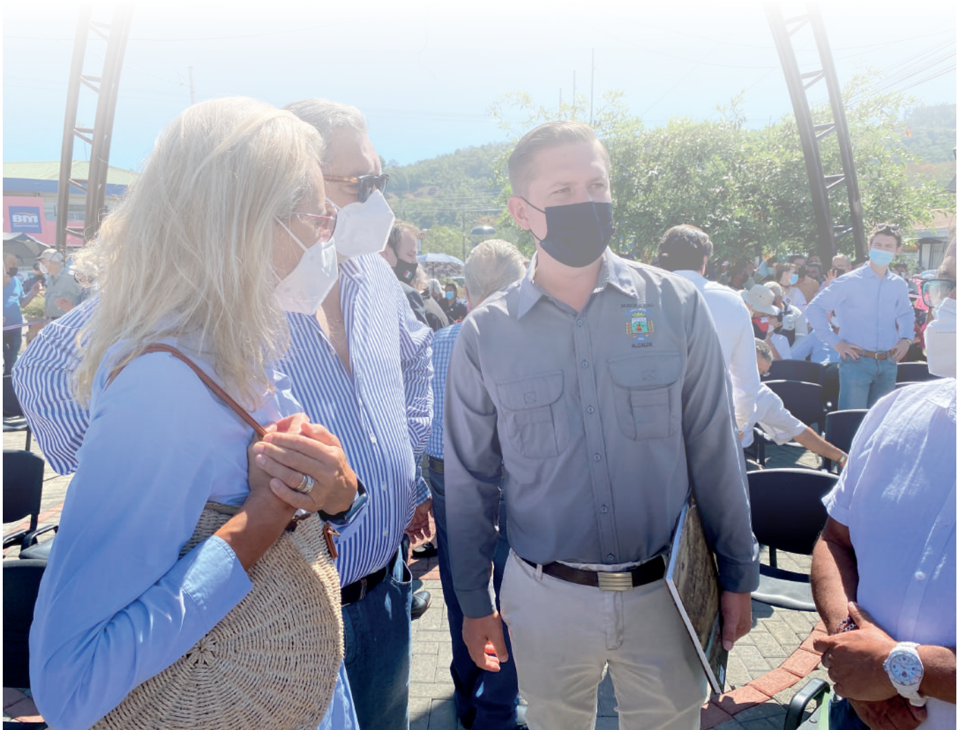
70 aniversario de OIM y San Vito, Coto Brus, Costa Rica