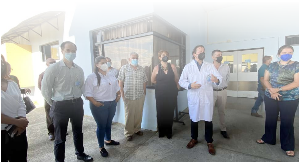
Maternidad y Pediatría San Vito, Coto Brus, Costa Rica